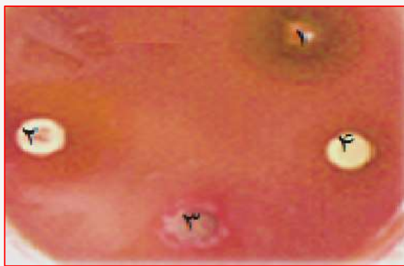
شکل ۱. بررسی اثر عصاره کلرلا ولگاریس بر باکتری

تست سمیت میگوی آب شور: در تست ارزیابی سمیت توسط آرتیمیا ارومیان، غلظت‌های ۱۰۰، ۵۰، ۲۵ mg/ml از ریز جلبک کلرلا ولگاریس به پلیت‌های کشت سلول اضافه گردید. در زیر نمودار فعالیت سمیت سلولی و تعداد لاروهای زنده گزارش شده است (شکل ۱).