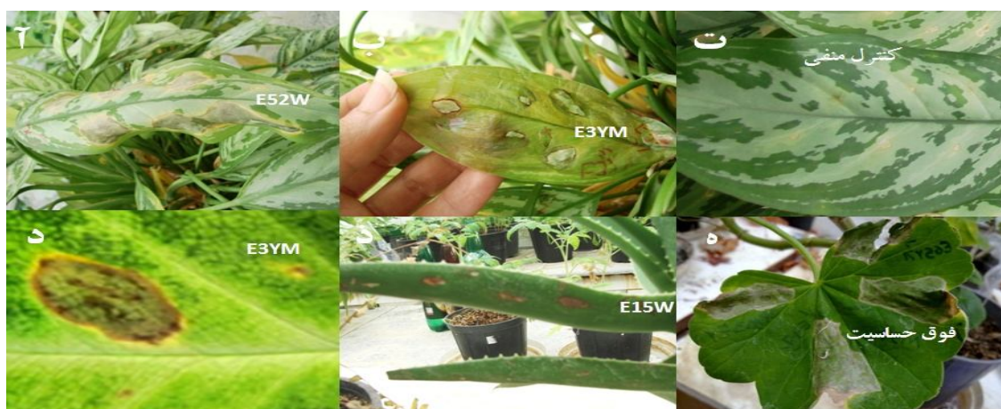
شکل ۱- علائم بیماری زایی روی گیاهان زیتنی شامل آگلونما ( Aglaonema treubii ) (آ.ب.ت)، سینگونوم ( Syngonium ) ( podophyllum ) (د)، آگاو ( Agave sp. ) (ذ)، و واکنش فوق حساسیت روی شمعدانی ( Pelargonium hortorum ) (س).