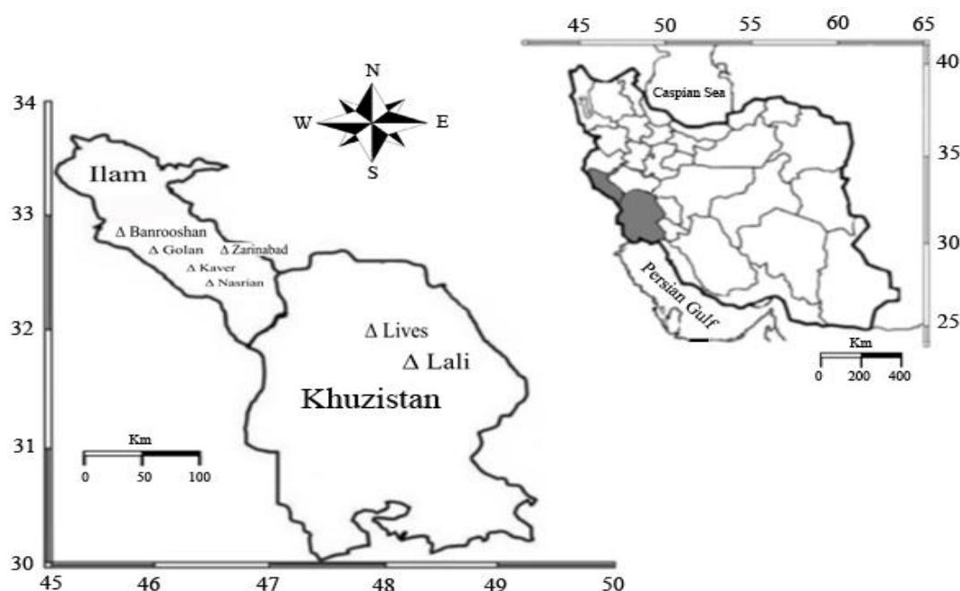
شکل ۱. نقشه مناطق جمع‌آوری مرزه رشینگری در استان‌های ایلام و خوزستان

آن به فاصله ۱۵ کیلومتر از همین منطقه در منطقه کاور با ارتفاع ۱۱۰۰ متر می‌باشد. در استان خوزستان نیز ارتفاع رویش بین ۶۰۰ تا ۸۰۰ متر از سطح دریا متفاوت بود. شیب زمین بین ۱۰ تا ۴۵ درجه در جمعیت‌های مختلف متفاوت بود (جدول ۱). این گیاه در استان ایلام در بیشتر نقاط کبیرکوه پراکنش وسیعی دارد و در شیب‌های شمالی و جنوبی رشد می‌کند. در تمام رویشگاه‌های شناسایی شده مرزه رشینگری بر روی