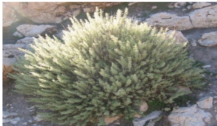
شکل ۲. مرزه رشینگری در مرحله گلدهی کامل (منطقه نصریان ایلام)

مساحت برگ بدست آمد. صفات طول و قطر کاسبرگ نیز دارای کمترین ضریب تنوع (به ترتیب ۱۶/۹۳ و ۱۹/۴۴ درصد) در بین جمعیت‌ها بودند، در حالی که در درون جمعیت‌ها بیشترین ضریب تنوع (۵۰/۲۱ درصد) برای مساحت برگ و کمترین ضریب تنوع (۷/۵۶ درصد) برای نسبت طول جام به طول کاسه در جمعیت نصریان ایلام دیده شد.