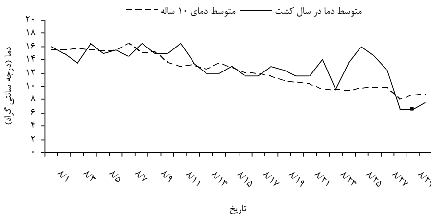
شکل ۱- متوسط دمای روزانه در فصل کشت و دمای ۱۰ ساله کرج. نقطه مشخص شده زمان محلول پاشی می‌باشد.

کامل تصادفی با سه تکرار انجام گرفت. رقم در دو سطح (آر جی اس: بهاره و حساس به سرما و لیکورد : پاییزه و مقاوم به سرما) و سالیسیلیک اسید در ۴ سطح صفر (شاهد)، ۱۰۰، ۲۰۰ و ۴۰۰ میکرومول در دو زمان محلول پاشی گردید. زمان محلول پاشی اول (شکل ۱) با توجه به نزدیک شدن دما به محدوده دمایی ۷-۱۰ درجه سانتی گراد (مرحله روزت) و محلول پاشی دوم (شکل ۲) با نزدیک شدن دما به محدوده دمایی ۷-۱۰ درجه سانتی گراد در اواخر زمستان (همراه با ساقه رفتن گیاه) با توجه به آمار ۱۰ ساله منطقه و داده‌های ایستگاه هواشناسی واقع در دانشکده کشاورزی تعیین گردید.