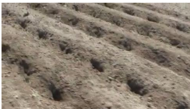
شکل ۵- مخازن ایجاد شده به وسیله ماشین Fig. 5. Reservoirs created by the machine

مخازن حفر شده توسط ماشین خاک‌ورز مخزنی و میزان رواناب اندازه‌گیری و بررسی گردید. برای اندازه‌گیری حجم مخازن مقدار معلومی شن نرم به کمک یک استوانه مدرج به داخل مخزن ریخته می‌شد تا مخزن پر شود. حجم شن به کار رفته برای پر کردن مخزن به عنوان حجم مخزن یادداشت می‌شد (ASTM, 1990). قبل از اجرای خاک‌ورزی مخزنی آبیاری پلات‌ها به روش بارانی انجام و رواناب اندازه‌گیری شد. پس از رسیدن رطوبت خاک به حد مناسب، در پلات‌های آزمایشی، به کمک ماشین ساخته شده خاک‌ورزی مخزنی انجام (شکل ۵) و پارامترهای عمق، فاصله و حجم مخازن اندازه‌گیری شدند. سپس مجدداً آبیاری بارانی پلات‌ها انجام و رواناب اندازه‌گیری شد.