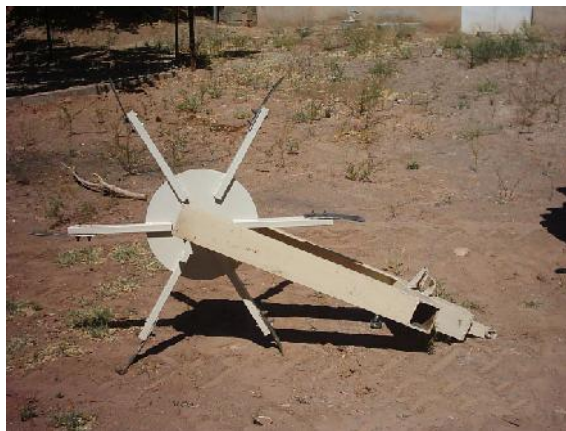
شکل ۳- عامل خاک‌ورز و شاسی

به آن‌ها وجود داشته باشد. بازوهای عامل خاک‌ورز به صورت شعاعی روی چرخ محمل سوار شده و به آن متصل شدند. در مرکز هر چرخ محمل یک بوش در نظر گرفته شد که محور از آن عبور داده شد. شش عدد بازو با فاصله ۶۰ درجه از یکدیگر