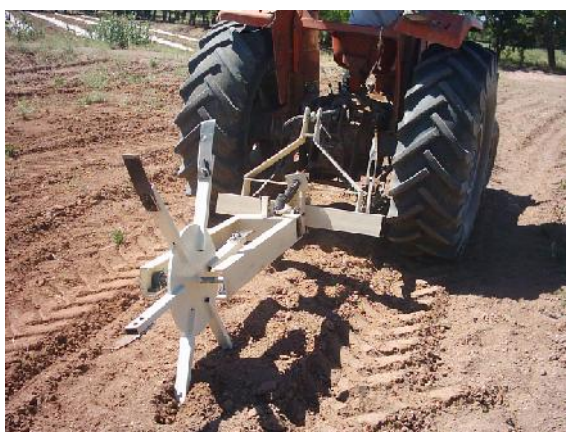
شکل ۴- ماشین خاک‌ورز مخزنی ساخته شده در حال کار

شاسی هر عامل خاک‌ورز با استفاده از ناودانی 8 \times 45 \times 80