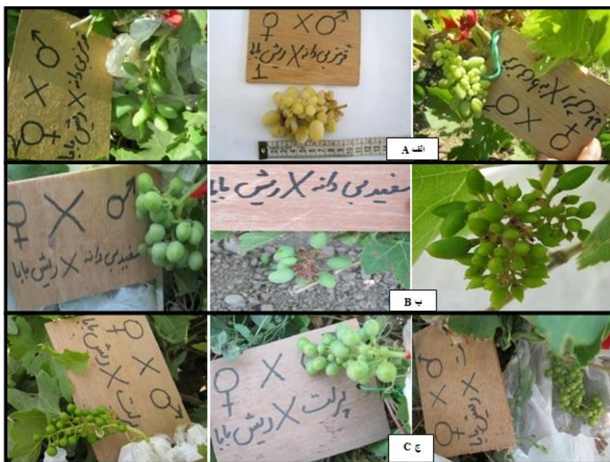
شکل ۳: نمونه‌هایی از نسل F 1 حاصل از دورگه‌رگیری رقم ریش بابا سفید با دانه گرده ارقام مختلف. الف) تلاقی رقم ریش بابا سفید با دانه گرده رقم بی‌دانه فرمز. ب) تلاقی رقم ریش بابا سفید با دانه گرده رقم سفید بی‌دانه. ج) تلاقی رقم ریش بابا سفید با دانه گرده رقم پرلت