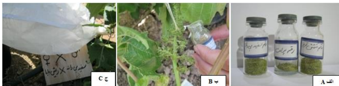
شکل ۲: الف) دانه گردهای به دست آمده از ارقام پدری. ب) گرده افشانی مصنوعی. ج) بسته بندی خوشه بعد از گرده افشانی با کیسه های کاغذی ضد آب برای محافظت از برخورد با سایر دانه گردها