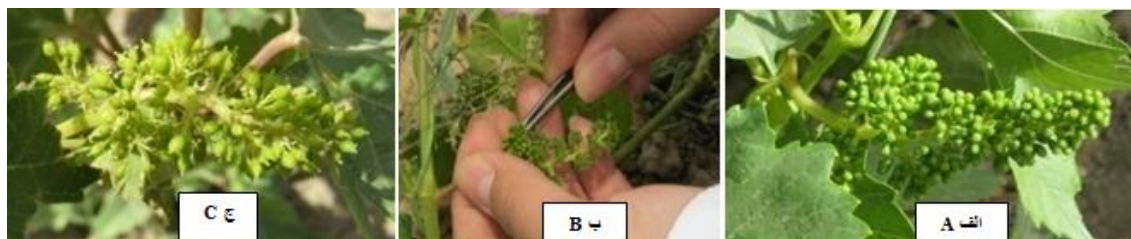
شکل ۱: مراحل اخته کردن یک خوشه گل رقم ریش بابا سفید. الف) خوشه گل رقم ریش بابا سفید قبل از باز شدن. ب) مرحله اخته کردن همان خوشه با انبرهای دم باریک. ج) همان خوشه پس از اتمام اخته کردن (فقط مادگی باقی مانده است) Fig. 1: The stage of emasculating a cluster of cv. Rish Baba Sefid. A) Flower cluster of cv. 'Rish Baba Sefid' before blooming. B) Emasculating of the same flower cluster with narrow tail pliers C) The same flower cluster after the emasculating (only pistils were remained)