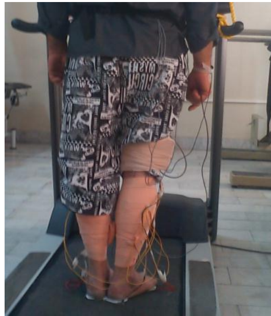
شکل ۱. فرد در حال انجام آزمون

و با توجه به این که اثر متقابل داده‌های شیب و سرعت بر فعالیت عضله گاستروکنمیوس داخلی معنی‌دار نبوده است ( p < 0/20 )، به بیان اثرات اصلی این متغیرها پرداخته‌ایم. فعالیت عضله گاستروکنمیوس داخلی سمت مبتلا با افزایش سرعت راه رفتن در همه شیب‌ها افزایش پیدا کرده است ( p = 0/047 ، ضریب رگرسیون = 0/336 و p < 0/001 ، ضریب رگرسیون = 0/71 )، به ترتیب برای سرعت‌های ۲۰٪ و ۴۰٪ افزایش سرعت دلخواه، جدول ۲)، به‌طور جالب فعالیت عضله گاستروکنمیوس داخلی با افزایش ۴۰٪ سرعت انتخابی فرد، بیش‌تر از افزایش ۲۰٪ سرعت انتخابی فرد بوده است ( p = 0/027 ) (شکل ۲). همان‌طوری‌که در جدول ۲ نشان داده شده است، تمایل به افزایش فعالیت عضله گاستروکنمیوس داخلی با افزایش شیب وجود داشته است گرچه این افزایش از نظر آماری معنادار نبوده است ( p = 0/06 ).