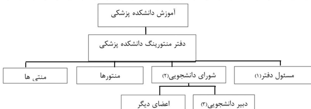
شکل ۱: چارت ساختار دفتر منتورینگ

مطالعه انجام شده یک مطالعه مقطعی بوده و جامعه هدف آن همه دانشجویان پزشکی ورودی سال ۹۶ دانشگاه علوم پزشکی تهران هستند که در طرح منتورینگ به عنوان منتی ثبت‌نام کرده‌اند. دفتر منتورینگ دانشکده پزشکی دانشگاه علوم پزشکی تهران از سال ۱۳۹۰ به عنوان زیرمجموعه آموزش دانشکده ثبت و اساس‌نامه آن تصویب شده است و از همان سال شروع به فعالیت کرده است. دفتر منتورینگ هر ساله دانشجویان سال اول را به عنوان منتی می‌پذیرد. شرکت در طرح منتورینگ برای دانشجویان جدیدالورود