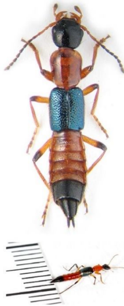
تصویر (۱): پدروس فوسیپس، گونه غالب در استان‌های شمالی کشور

آسیب‌های داخلی بسیار شدید، تزریق وریدی موجب مرگ، و تماس آن با سطح پوست، منجر به‌نوعی درماتیت تماسی تاوولی سوزش‌دار