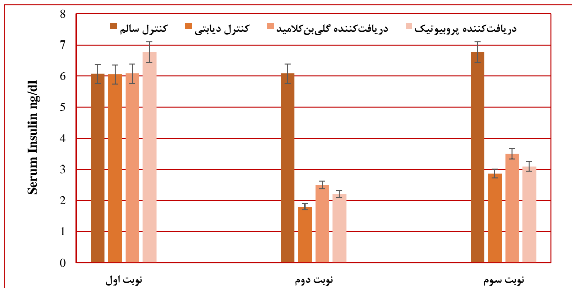
نمودار ۲- مقایسه سطح انسولین خون در گروه‌های مختلف در موش‌های نر (میانگین \pm انحراف معیار)

نتایج مربوط به مطالعه بافتی پانکراس: در گروه سالم جزایر لانگرهانس کاملاً سالم، آسینی‌های ترشحی پانکراس سالم و نکروز دیده نشد (شکل ۱- الف). در برش‌های تهیه‌شده از موش‌های دیابتی بیشتر جزایر کوچک و به‌ندرت دارای سائز متوسط بودند دانسیته سیتوپلاسم سلول‌های جزایر لانگرهانس کاهش‌یافته، واکوتل‌های سیتوپلاسمی و نکروز مشاهده می‌شود (شکل ۱- ب). در گروه دریافت‌کننده گلی‌بن‌کلامید، کاهش دانسیته سیتوپلاسمی سلول‌های جزایر لانگرهانس و واکوتل‌های سیتوپلاسمی مشاهده می‌شود. رشته‌های همبندی فراوان و فیبروز جزایر قابل‌مشاهده است (شکل ۱- ج).