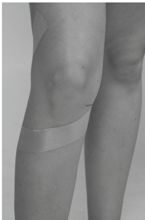
شکل ۱: تیپینگ مولیگان زانو

تیپینگ، تمامی آزمون‌های سنجش به همان شیوه پیش آزمون تکرار و در نهایت داده‌های جمع‌آوری شد. از آمار توصیفی جهت محاسبه میانگین و انحراف استاندارد، دامنه تغییرات، سن، قد، وزن و شاخص توده بدنی آزمودنی‌ها استفاده شد. همچنین برای تجزیه و تحلیل و بررسی نرمال بودن توزیع داده‌ها از آزمون کلموگروف اسمیرنوف و برای مقایسه پیش آزمون و پس آزمون، آزمون آماری تی وابسته در سطح معناداری ۹۵٪ ( \alpha \leq 0/05 ) مورد استفاده قرار گرفت. برای انجام تمام محاسبات نرم‌افزار SPSS ورژن ۲۰ و Excel استفاده شد.