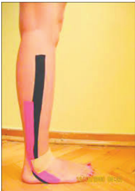
شکل ۳. نحوه انجام تیپینگ مچ پا

به پشت قرار گیرند، سپس فاصله بین خار خاصره قدامی فوقانی تا بخش دیستال قوزک داخلی پا اندازه‌گیری شد، برای هر آزمودنی و هر پا دو مرتبه تکرار و میانگین گرفته شد؛ سپس میانگین محاسبه شده به عنوان اندازه طول پا استفاده گردید. در این پژوهش از آزمون تعادلی وای استفاده شد. آزمودنی در مرکز جهات می‌ایستاد و سپس بر روی یک پا قرار می‌گرفت و با پای دیگر عمل دستیابی را انجام و به حالت طبیعی روی دو پا گرفت و پیش از انجام کوشش بعدی به مدت ۱۰ تا ۱۵ ثانیه در این حالت ماند. تمام کوشش‌ها در یک جهت قبل از رفتن به جهت دیگر باید تکمیل شدند و باید در یک ترتیب متوالی ساعت‌گرد یا پادساعت‌گرد انجام گردید. آزمودنی با پنجه پا دورترین نقطه ممکن را در هر یک از جهات تعیین شده لمس می‌کرد، فاصله محل تماس تا مرکز، فاصله دستیابی بود که جهت به‌دست آوردن اختلاف بین میانگین نمرات تعادل وای به سانتی‌متر اندازه‌گیری می‌شد (۳۱) .