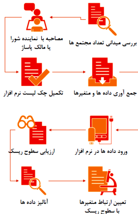
شکل ۱- فلودیاگرام روش بررسی مطالعه

بازار و مداخلات آموزشی در بین شاغلین بایستی انجام گردد (۵). مطالعه حاضر سعی در جبران این خلاء نموده است. به منظور بررسی وضعیت ایمنی مجتمع‌های تجاری تهران، ناحیه منطقه ۱۲ شهرداری که دارای بیشترین تراکم مجتمع‌ها بوده و دارای اهمیت استراتژیک سیاسی، اقتصادی، فرهنگی و تاریخی می‌باشد، جهت اجرای مطالعه انتخاب گردید.