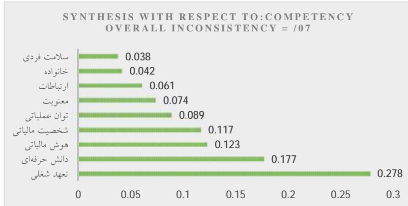
نمودار 2. رتبه‌بندی اهمیت مقوله‌های شایستگی

داده‌های به‌دست‌آمده از نظرات خبرگان با استفاده از نرم‌افزار اکسپرت چویس نسخه 11 1 تجزیه و تحلیل شدند که نتایج به‌دست آمده در نمودار نشان داده شده است.