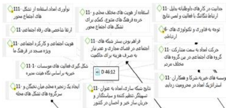
شکل 1. برشی از کدگذاری یکی از مصاحبه‌ها در نرم‌افزار اطلس‌تی 8

کدگذاری باز، مفهوم‌سازی در اولین سطح انتزاع است و بهتر است توجه پژوهشگر معطوف به درک مفهوم مورد بحث باشد و نه به واژه‌هایی که برای تشریح رویدادها به کار می‌رود [35]، ص 110]. از این رو در این پژوهش به کدگذاری نکات و مفاهیم کلیدی به جای تحلیل جزء به جزء و بسیار خرد پرداخته شد تا تمرکز بیشتری روی مفهوم اصلی انجام شود. همچنین مقایسه مستمر به شکل مداوم در طول فرایند پژوهش انجام شد و رفت و برگشتی بودن فرایند به شکل مطلوب رعایت گردید. علاوه بر این، به دلیل اهمیت یادداشت‌های نظری در رویکرد کلاسیک، طی فرایند کدگذاری باز، نکات مهم و کلیدی در بخش یادداشت‌های نرم‌افزار اطلس‌تی ثبت می‌شد تا پرورش مفاهیم و شکل‌گیری روابط آنها به خوبی انجام شده و در نهایت، نظریه اصلی از غنای نظری مطلوبی برخوردار باشد. شکل 1 بخشی از کدگذاری یکی از مصاحبه‌ها را در نرم‌افزار اطلس‌تی نشان می‌دهد.