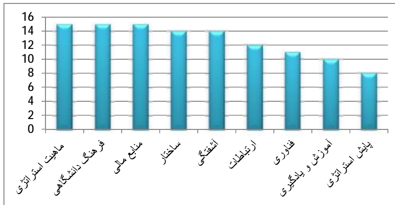
شکل 2. رتبه بندی موانع اجرای کارآمد استراتژی در دانشگاه‌ها و مراکز آموزش عالی