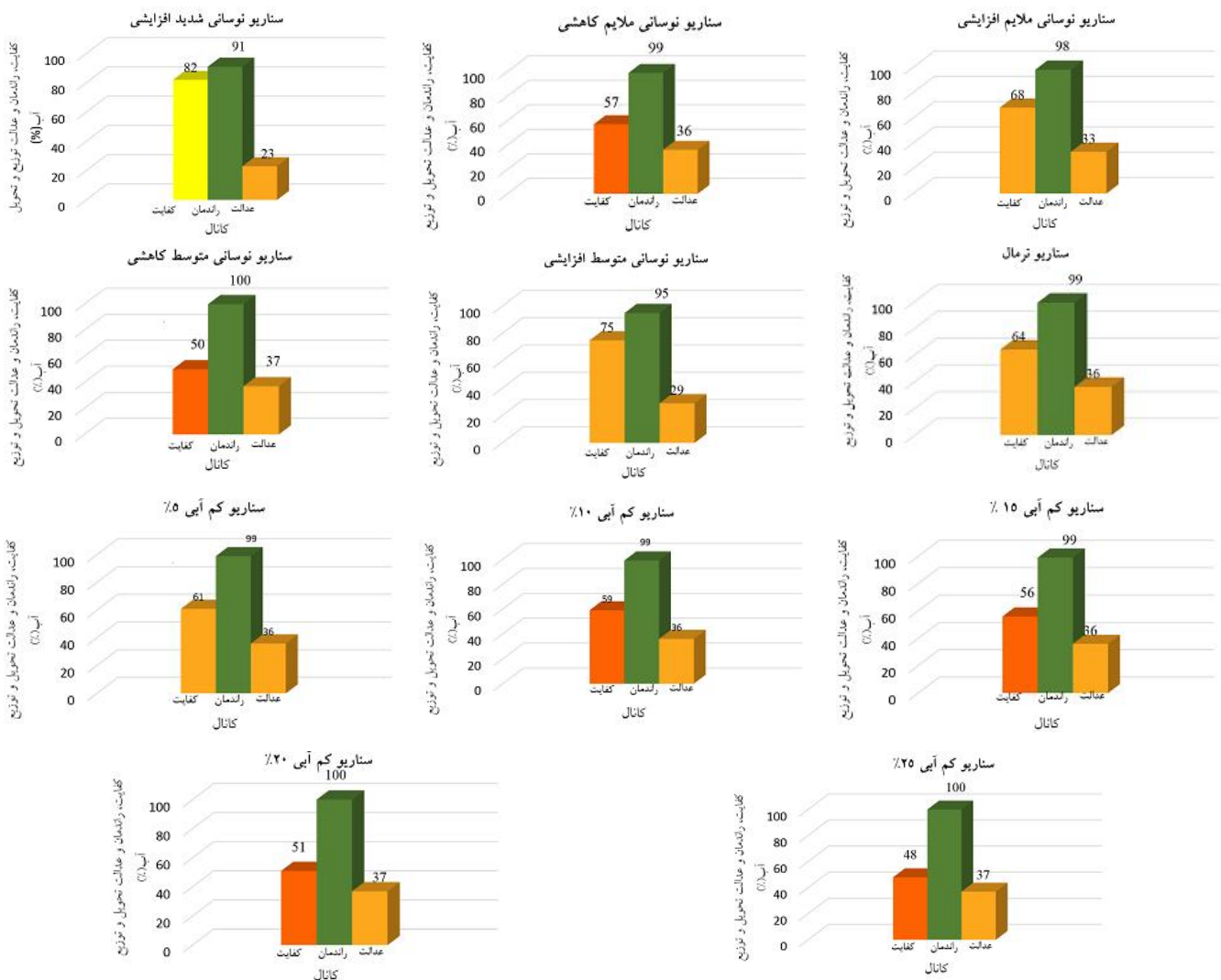
شکل ۳. کفایت، راندمان و عدالت تحویل و توزیع آب در طول کل کانال به تفکیک سناریوهای مختلف بهره‌برداری

می‌دهد از نظر متخصصین در درجه سوم اهمیت قرار داد.