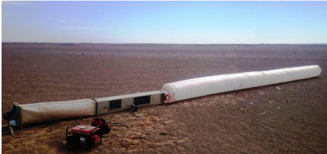
شکل ۲. تونل باد به کار برده شده در صحرا روی نمونه خاک‌های دست‌نخورده

دستگاه پره برشی جیبی اندازه‌گیری شد (۳). درصد سنگریزه سطحی (بزرگ‌تر از ۲ میلی‌متر) به‌روش فتوگرافی اندازه‌گیری شد (۲۴). توزیع اندازه ذرات اولیه (بافت خاک) به‌روش هیدرومتری تعیین شد (۱۶). روش الک خشک به‌منظور تعیین توزیع اندازه ذرات ثانویه استفاده شد (۲۱). بر اساس نتایج حاصل از توزیع اندازه ذرات خاک‌ها، پارامترهای توصیف‌کننده توزیع اندازه ذرات خاک از قبیل میانگین وزنی قطر ذرات ثانویه (MWD) (۲۱) و درصد خاکدانه‌های بزرگ‌تر از ۰/۲۵ میلی‌متر (DSA>0.25mm) (۲۵) تعیین شدند.