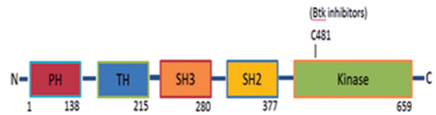
شکل ۱: ساختار ژن BTK (۱۶)