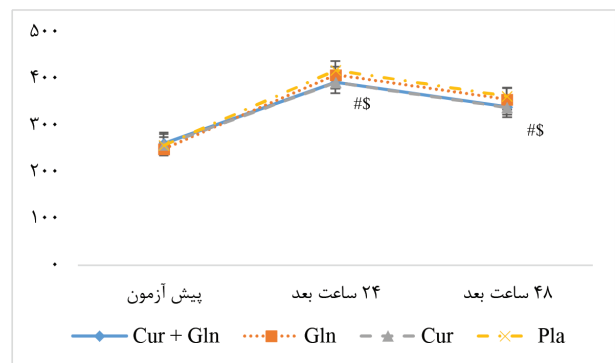
شکل ۲. مقایسه تغییرات لاکتات دهیدروژناز سرم در مراحل مختلف پیش و پس از فعالیت مقاومتی # اختلاف معنی دار گروه (Cur + Gln) با گروه دارونما ( P < 0.05 ). $ اختلاف معنی دار گروه (Cur) با گروه دارونما ( P < 0.05 ).