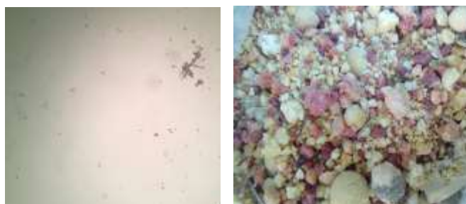
تصویر ۲: تصویر ماکروسکوپی اندروت (شکل راست)، تصویر میکروسکوپی اندروت با بزرگنمایی \times 10 (شکل چپ)