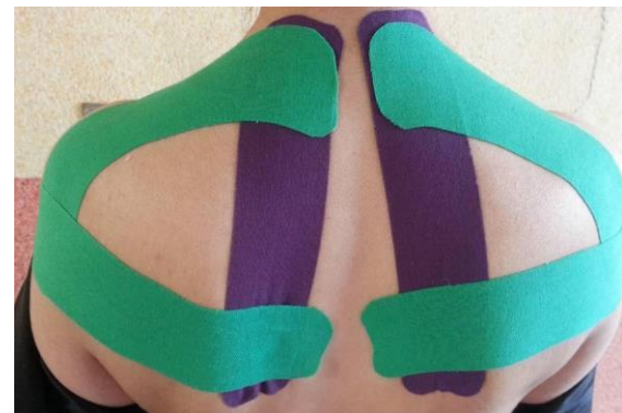
شکل ۲. تصویر نوار Tape نصب شده

پس از جمع‌آوری داده‌ها، هر گروه، قبل و بعد از مداخله‌ی ارزیابی و مقایسه‌ی بین اندازه‌های کمی در دو گروه مستقل با استفاده از آزمون Independent t و Paired t صورت گرفت. آزمون‌های آماری به منظور مقایسه‌ی میانگین زوایا قبل و بعد از درمان در دو گروه و نیز مقایسه‌ی هر دو گروه با هم انجام گرفت. همچنین، مقایسه‌ی میانگین زوایا پس از مداخله با دو ماه بعد در هر دو گروه، با استفاده از آزمون Dependent t و در نهایت، جهت مقایسه‌ی میزان تغییرات دو گروه، از آزمون Independent t استفاده شد. کلیه‌ی آزمون‌ها، در سطح معنی‌داری P < 0.05 با استفاده از نرم‌افزار آماري SPSS نسخه‌ی ۲۴ (version 24, IBM Corporation, Armonk, NY) انجام شد.