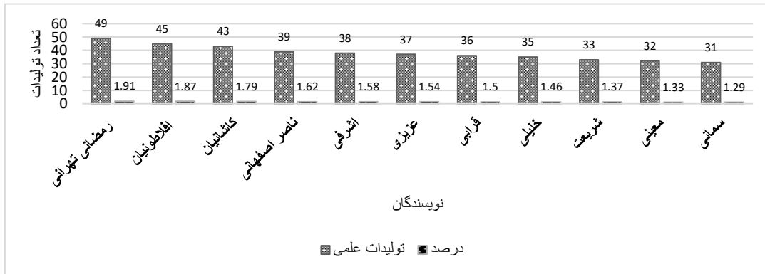
نمودار ۱: رتبه‌بندی نویسندگان پرتولید ایران از لحاظ چاپ مقاله در حوزه زنان و زایمان پیش و پس از طرح تحول نظام سلامت