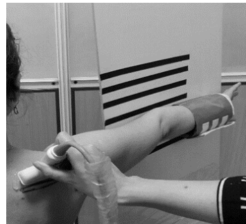
شکل ۲: ضخامت سونوگرافیک عضله در وضعیت آزمون Empty can