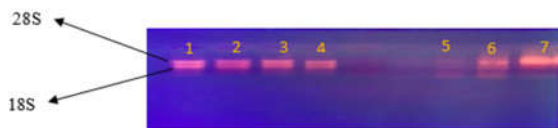
شکل ۱: الکتروفورز بر روی ژل آگارز برای بررسی کیفیت RNA استخراج شده. شماره ۱-۶: نمونه‌ها، شماره ۷: مارکر.

نسبت جذب ۲۶۰ به ۲۸۰ nm تعیین کننده خلوص اسیدهای نوکلئیک می‌باشد و در پژوهش کنونی، این نسبت جذب، بین ۱/۸ تا ۲ بود و کیفیت RNAهای استخراج شده، تایید شد. میزان کارایی