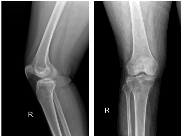
شکل ۲ - برخی از بیماران یک سال و نیم پس از عمل هیچ عود موضعی نداشتند.