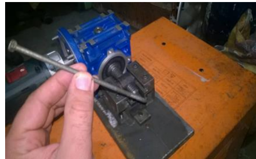
شکل-۵. دستگاه برشگر هوشمند پین‌های ارتوپدی

به عنوان مشخصه دیگری از این وسیله می‌توان به قرارگیری خط‌کشی اشاره کرد که به وسیله آن می‌توان میزان دقیق پین جدا شده را مشخص کرد. از طرف دیگر و با توجه به اینکه عمل ارتوپدی یکی از حساس‌ترین اعمال جراحی از لحاظ احتمال عفونت است، بنابراین کوتاهی زمان عمل بسیار حائز اهمیت می‌باشد که با بکارگیری از این ابزار می‌توان به خوبی زمان عمل و در نتیجه احتمال عفونت را کاهش داد. رویه و فرآیند برش پین به گونه‌ای است که با فشار دادن اهرم تعبیه شده در دستگاه، تیغه به سمت پایین حرکت کرده و پین را قطع می‌کند (پین در مجاورت خط‌کش سمت چپ کمک جراح قرار می‌گیرد) (شکل ۵-۵) (شکل ۶-۶).