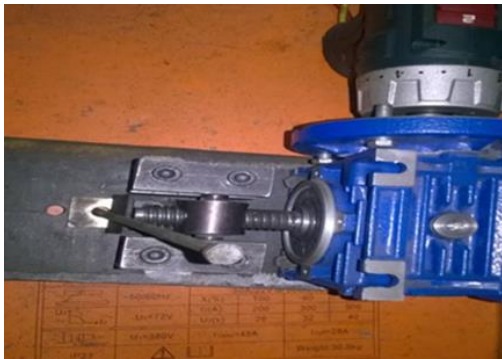
شکل-۴. نحوه عملکرد دستگاه از نمای بالا