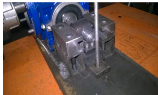
شکل-۳. سیستم کامل دستگاه بعد از پیاده سازی

با آماده شدن مدارهای الکترونیکی، اجزای الکترونیکی نظیر خازن‌ها، القایی، اجزاء IC و میکرو الکترونیک بر روی مدار نصب شدند. با تکمیل بخش سیستم موتور و دستگاه مکانیکی، قطعات مکانیکی و الکترونیکی متصل می‌شوند و سیستم نهایی مورد آزمایش قرار می‌گیرد (شکل-۳).