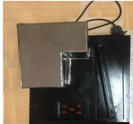
شکل-۶. تصویر نهایی دستگاه