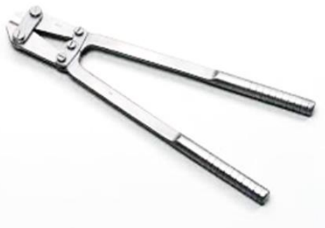
شکل-۱. برشگرهای مرسوم و سنتی

از طرفی خطر پرتاب اضافات پین برش خورده به اطراف و احتمال برخورد آن با بیمار و تیم جراحی در زمان بکارگیری از این وسیله بسیار بالاست. به همین علت بر آن شدیم تا وسیله‌ای طراحی و جایگزین کنیم که علاوه بر کوچکتر، سبکتر و ایمن تر بودن امکان استریل و بسته‌بندی کردن آن راحت تر باشد.