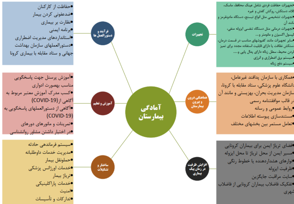
شکل-۱. الگوی آمادگی بیمارستان برای مقابله با بیماری کووید-۱۹ (۱۷)

که مدیران از طریق پرتال بیمارستان پرسشنامه‌ی طراحی شده را برای بخش‌های اورژانس، پرستاری، بخش مراقبت‌های ویژه ICU و پزشکان متخصص عفونت ارسال نمایند. بعد از ارسال پرسشنامه آنلاین به مدیران بیمارستان و تکمیل پرسشنامه از جانب آن‌ها اقدام به جمع‌آوری و تجزیه و تحلیل داده‌ها شد. شیوه امتیازبندی سؤالات به این صورت بود که سوالاتی که با (بله) پاسخ داده شده بود ۲ امتیاز منظور شد و برای سوالاتی که با (تا حدودی) پاسخ داده شده بود امتیاز ۱ و سوالاتی که با (خیر) پاسخ داده شده بود صفر امتیاز در نظر