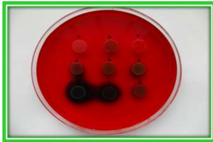
تصویر ۱: بررسی فنوتیپی بیوفیلیم در ایزوله‌های استافیلوکوکوس ارتوس: a: کلنی‌های بی‌رنگ نشان دهنده عدم تشکیل بیوفیلیم، b: رنگ قهوه‌ای تولید بیوفیلیم متوسط و c: کلونی‌های سیاه نشان دهنده تشکیل بیوفیلیم قوی