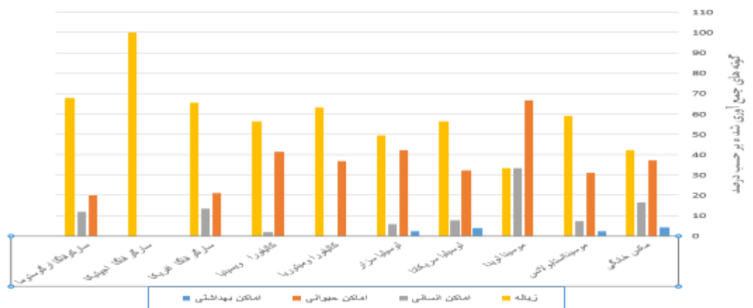
نمودار ۱: رابطه بین درصد گونه‌های جمع‌آوری شده بر حسب محل صید در سال ۱۳۹۷ شهرستان رامیان

بیشترین تعداد گونه مگس از محل‌های جمع‌آوری زباله و اماکن حیوانی صید گردید ( نمودار ۱). بررسی آزمایشگاهی و تشخیص گونه‌ها بر اساس کلید استاندارد نشان داد که ۱۰ گونه موسینیا استابولانس، موسکا دومستیکا، موسینا لویدا، لوسیلیا سزار، لوسیلیا ساریکاتا، کالیفورا ویسینا، کالیفورا میتوریا، سارکوفاگا اجپتیکا، سارکوفاگا آرگروستوما، سارکوفاگا آفریکا و متفرقه در شهرستان رامیان وجود دارد. از این تعداد، ۶۵۱ عدد (۱۹/۳۶ درصد) مگس از طریق تله و تعداد ۲۷۱۳ عدد (۸۰/۶۴ درصد) مگس به وسیله توری حشره‌گیری صید گردیدند. در روش استفاده از تور حشره‌گیری ۱۷۶۹ مگس (۶۵/۲ درصد) از خانواده موسیده، ۸۴۱ مگس (۳۱ درصد) از خانواده کالیفورنیه و ۹۴ (۳/۸ درصد) از خانواده سارکوفازیده صید شدند. در روش صید با استفاده از تله بطری تعداد ۲۸۹ مگس (۴۴/۴ درصد) از خانواده موسیده، ۳۲۷ عدد (۵۰/۲۲ درصد) از خانواده کالیفورنیه و ۳۵ عدد (۵/۳۸ درصد) از خانواده سارکوفازیده جمع‌آوری شدند. بیشترین تعداد