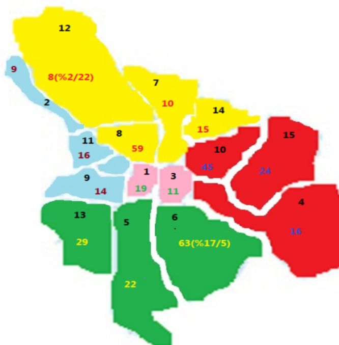
شکل شماره ۱ - توزیع محل سکونت بیماران شناسایی شده در مطالعه مورد- شاهدی همه‌گیری اسهال در شهر اصفهان در بهار ۱۳۹۴ بر حسب حوزه‌ی جغرافیایی و مناطق شهرداری