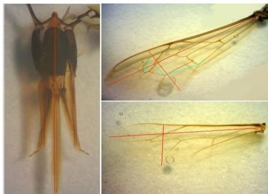
شکل ۱. صفات اندازه‌گیری شده با نرم‌افزار Digimizer. خطوط قرمز فواصل و خطوط آبی زوایا را نشان می‌دهند. Figure 1. Honey bee characters evaluated with Digimizer. The red lines indicate distances and blue lines indicate the angles

بال جلو، طول و عرض بال جلو، طول و عرض بال عقب و طول خرطوم، با نرم‌افزار Excel و SPSS v. 20 تجزیه و تحلیل شد که نتایج حاصل از این داده‌ها در جدول ۱ آمده است. همان‌طور که مشخص است، در مقایسه میانگین زوایا، بین نژاد بومی و هیبرید کارنیکا اختلاف وجود دارد. این اختلاف در دو زاویه از بال جلو شامل A4 و G18 به‌طور معنی‌دار دیده می‌شود که می‌تواند منجر