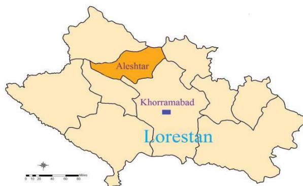
شکل ۱: نقشه جغرافیایی منطقه الشتر استان لرستان

ارتفاعات برف‌گیر لرستان از جمله منطقه کوهستانی سفیدکوه و نوژیان در خرم‌آباد، گرین و الشتر (سراب کهمان)، بروجرد، الیگودرز، نورآباد و اشترانکوه، جزو مناطق سردسیر استان لرستان محسوب می‌شوند (شکل ۱). منطقه الشتر با مختصات جغرافیایی 48^{\circ} 15' E و 33^{\circ} 49' N ، به مساحت 1/788 کیلومتر مربع در شمال لرستان واقع شده است. به‌منظور شناسایی و معرفی گونه‌های دارویی بومی منطقه مورد مطالعه،