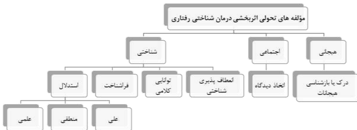
شکل شماره ۲: مؤلفه‌های تحولی اثربخشی درمان شناختی رفتاری

مانند کودکان مبتلا به اتیسم را باید از کودکان عادی در این زمینه مستثنی نمود و این کودکان به دلیل مشکلات و تأخیرهای رشدی احتمالاً در بهره‌مندی از این درمان دچار مشکلاتی خواهند بود. از آنجاکه توجه به نقش تحول در بهره‌مندی کودکان از درمان تأثیرگذار است، بهتر است پژوهش‌های کمی و کیفی بیشتری در این زمینه انجام گیرد. از جمله توجه به کارکردهای اجرایی و نقش آن‌ها در پیامدهای درمان‌های روان‌شناختی کودکان می‌تواند مدنظر قرار گیرد. ساخت مقیاسی برای سنجش توانایی