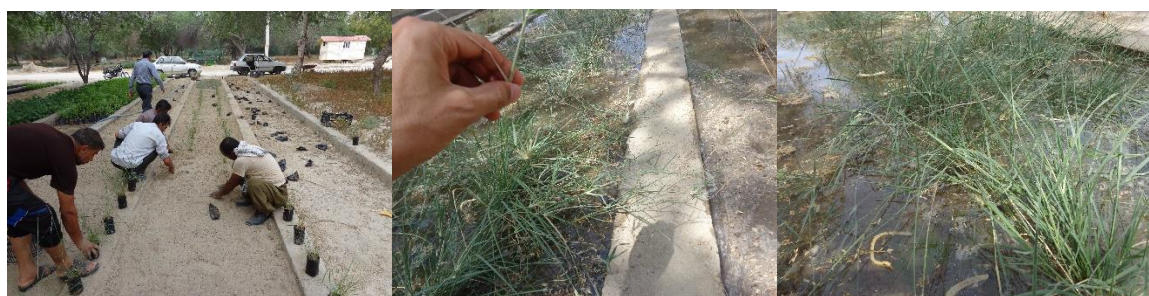
شکل ۴. انتقال به کرت‌ها در نهالستان به منظور قلمه‌گیری از پایه‌های تولید شده قلمه استولون برای استفاده‌های آتی

۴. بحث و نتیجه‌گیری با توجه به نتایج حاصل از این پژوهش، تولید نهال از بذر هر سه گونه گیاهی Ael.lagopoides ، Hal.mucronatum و Spo.arabicus موفقیت چندانی نداشت. این نتیجه با نتایج [۱۴] هم‌خوان نیست. نتایج [۱۴] حاکی از جوانه‌زنی و تولید بوته از بذرهای