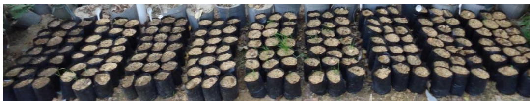
۲) گونه Halopyrom mucronatum ۳) گونه Aeluropus lagopoides ۴) گونه Halopyrom mucronatum ۵) قلمه شاخه رونده گونه Halopyrom mucronatum