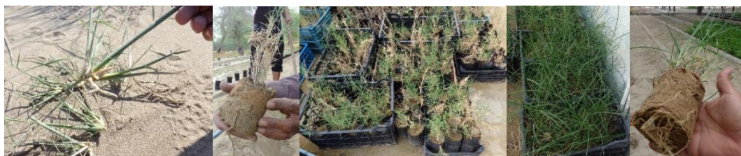
شکل ۲. تولید نهال گلدانی به روش قلمه. از راست به چپ: ۱) گونه Sporobolus arabicus

بذرهای و استولن‌های جمع‌آوری شده در گلدان‌های پلاستیکی به قطر 20 سانتی‌متر که با ماسه‌های منتقل شده از نزدیک‌ترین روی‌شگاه گونه‌ها پر شد، کاشته شد. استولون‌ها به قطعات جداگانه‌ای تقسیم شد به نحوی که هر استولون در بر گیرنده یک گره به همراه حداقل دو سانتی‌متر از دو انتهای گره بود. تولید نهال گلدانی از بذر با 3 تیمار شاهد، خیس‌سازدن در آب گرم (دمای 20^{\circ}\text{C} ) و اسید جیبرلیک 1000 پی پی ام به مدت 12 ساعت در دمای 20^{\circ}\text{C} انجام گرفت. تعداد نمونه‌ها، 21 نمونه از هر تیمار با سه تکرار بود. همچنین زمان آماربرداری نهایی، یک‌ماه پس از تولید نهال در نظر گرفته شد که در طی آن رویش بذر و زنده‌مانی و رویش قلمه‌ها به عنوان شاخص‌های گیاهی مورد ارزیابی قرار گرفتند. آزمون آماری به صورت فاکتوریل در قالب طرح کاملاً تصادفی در 3 تکرار، هر تکرار 21 نمونه (شکل شماره ۲ و