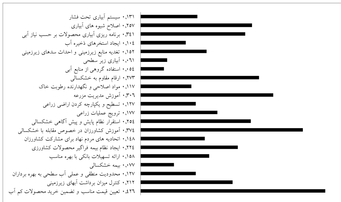
شکل ۳- وزن هر یک از راهکارهای مقابله با خشکسالی