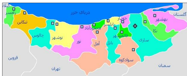
شکل ۱- محدوده مورد مطالعه

همگنی خاصی بوده و تعاملات گسترده‌ای در آن مشاهده می‌شود. شهر تنکابن در فاصله ۲۴۶ کیلومتری از مرکز استان مازندران (ساری) و ۲۵۸ کیلومتری از شهر تهران قرار دارد. نزدیک‌ترین شهر به آن خرم‌آباد با ۴ کیلومتر فاصله می‌باشد و غربی‌ترین شهر استان (رامسر) نیز در فاصله ۲۵ کیلومتری آن قرار گرفته است. این شهر به شکل طولی در بستر جغرافیایی ناحیه شکل گرفته است.