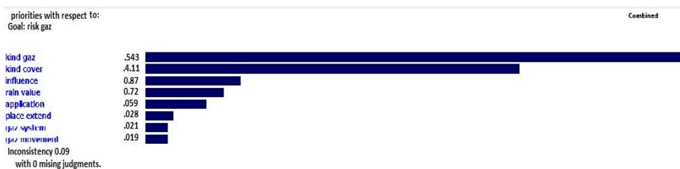
شکل ۵- اولویت بندی پارامترها

پس از این مرحله پارامترهای مورد بررسی اولویت بندی و وزن دهی می شوند: