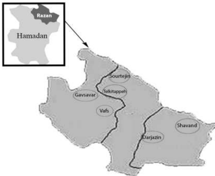
شکل ۱. نقشه جغرافیایی مناطق مورد مطالعه برای شناسایی ژنوتیپ‌های برتر گردو در شمال استان همدان Figure 1. Geographical map of the studied sites for identification of walnut superior genotypes in north of Hamedan province

۲۷۰ ژنوتیپ بالغ گردو آغاز گردید. از جمله صفات حائز اهمیت در پیش انتخاب ژنوتیپ‌های مورد مطالعه، دیر برگدهی، مقاومت به سرما، عدم آلودگی به آفات و امراض، عملکرد بالا، درصد مغز بالا، مغز روشن، سهولت جدا شدن مغز از پوست سخت چوبی و نازک بودن پوست دانه بود. در ادامه پس از پلاک کوبی، ژنوتیپ‌ها بر اساس دو توصیف‌نامه ارزیابی گردو IPGRI و UPOV که به ترتیب توسط مؤسسه بین‌المللی منابع ژنتیکی گیاهی و اتحادیه بین‌المللی حمایت از ارقام جدید گیاهی تهیه شده است، مورد مطالعه و بررسی قرار گرفتند (Vezaei et al. , 2003). پس از ارزیابی‌های مورفولوژیک و فنولوژیک ۲۷۰ ژنوتیپ مورد مطالعه، تعداد ۸۴ ژنوتیپ جهت ارزیابی‌های بعدی انتخاب گردید.