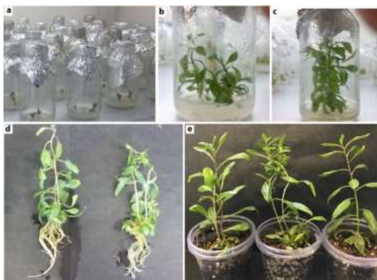
شکل ۱. مراحل مختلف ازدیاد درون‌شیشه‌ای گیاه Lycium depressum : (a) مرحله استقرار ریزنمونه‌ها، (b) مرحله پرآوری در محیط کشت MS حاوی ۰/۵ میلی‌گرم بر لیتر BAP، (c) مرحله ریشه‌زایی ریزنمونه‌ها در محیط کشت MS/2 در شرایط درون‌شیشه‌ای، (d) گیاهچه‌های ریشه‌دار شده در محیط کشت MS/2 حاوی ۰/۳ میلی‌گرم بر لیتر IBA، (e) گیاهچه‌های سازگار شده پس از گذشت یک ماه از انتقال به شرایط برون‌شیشه‌ای در اتاقک رشد

در این مطالعه بالاترین غلظت TDZ (۲ میلی‌گرم بر لیتر) اثر بازدارندگی روی رشد گیاه داشت و گیاهان پس از ۱۰ روز از شروع آزمایش در این تیمار از بین رفتند. به نظر می‌رسد که TDZ در غلظت‌های بالا برای گیاه حالت سمیت ایجاد نموده است. بسیاری از تحقیقات گذشته نیز نشان داده‌اند که TDZ در غلظت‌های پایین‌تر اثر مؤثرتری بر میزان پرآوری گیاهان داشته است (Kumar & Reddy, 2010; Lu, 1993). TDZ همچنین در کمترین غلظت (۰/۰۰۲ میلی‌گرم بر لیتر)، منجر به تولید شاخساره‌هایی با طول زیاد نسبت به شاهد گردید هر چند تفاوت معنی‌داری بین طول شاخساره‌های تولید شده در این تیمار، در مقایسه با تیمار ۰/۵ میلی‌گرم بر لیتر BAP مشاهده نشد و با افزایش غلظت TDZ طول شاخساره به‌طور معنی‌داری کاهش پیدا نمود. این کاهش اندازه طول شاخساره در حضور غلظت‌های بالای TDZ