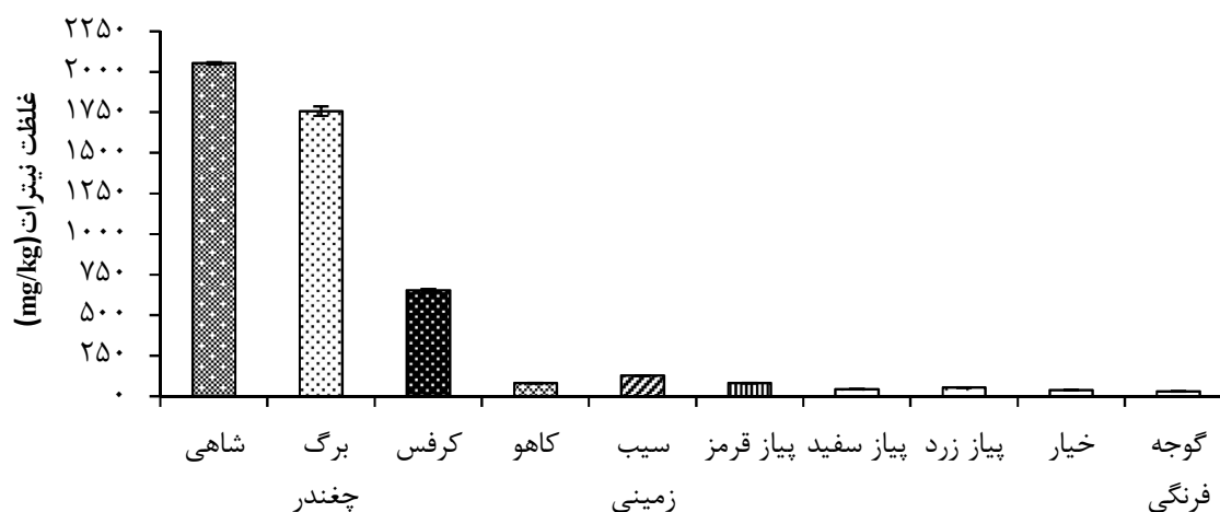
نمودار ۲- میانگین غلظت نیترات براساس وزن تر در سبزیجات مختلف موجود در بازارهای تره‌بار شهر کرمانشاه

در نمونه‌ها نداشته است. عوامل مختلفی نظیر شرایط جغرافیایی، نوع و واریته سبزی و شرایط کشت می‌توانند بر میزان رطوبت نمونه‌ها تاثیر بگذارند (۹). با توجه به نتایج به‌دست آمده از این مطالعه در غلظت نیترات بیشتر سبزیجات بین بازارهای مختلف اختلاف معنی‌دار وجود داشت که با توجه به اینکه در زمان‌های مختلفی از این بازارها نمونه‌برداری شده است، این نتیجه منطقی به نظر می‌رسد. همچنین، غلظت نیترات در مورد بیشتر سبزیجات و در بازارهای مختلف کمتر از حد مجاز WHO و ISIRI بود. غلظت نیترات در سبزی‌های مختلف عمدتاً در بازار توپخانه نسبت به بقیه بازارها بیشتر بود. پس از آن بازارهای مسکن و آزادی بالاترین غلظت نیترات را داشتند. لازم به ذکر است که تنها در مورد سیب‌زمینی، پیاز قرمز، کرفس، برگ چغندر و شاه‌هی غلظت‌ها بیش از حد مجاز ISIRI بودند و عمدتاً این غلظت بالا در بازارهای توپخانه و سپس آزادی مشاهده شد. از آنجایی که هر شهر دارای یک میدان اصلی تره‌بار بوده و بقیه بازارهای موجود در شهر سبزیجات خود را عمدتاً از این مکان تامین می‌کنند و