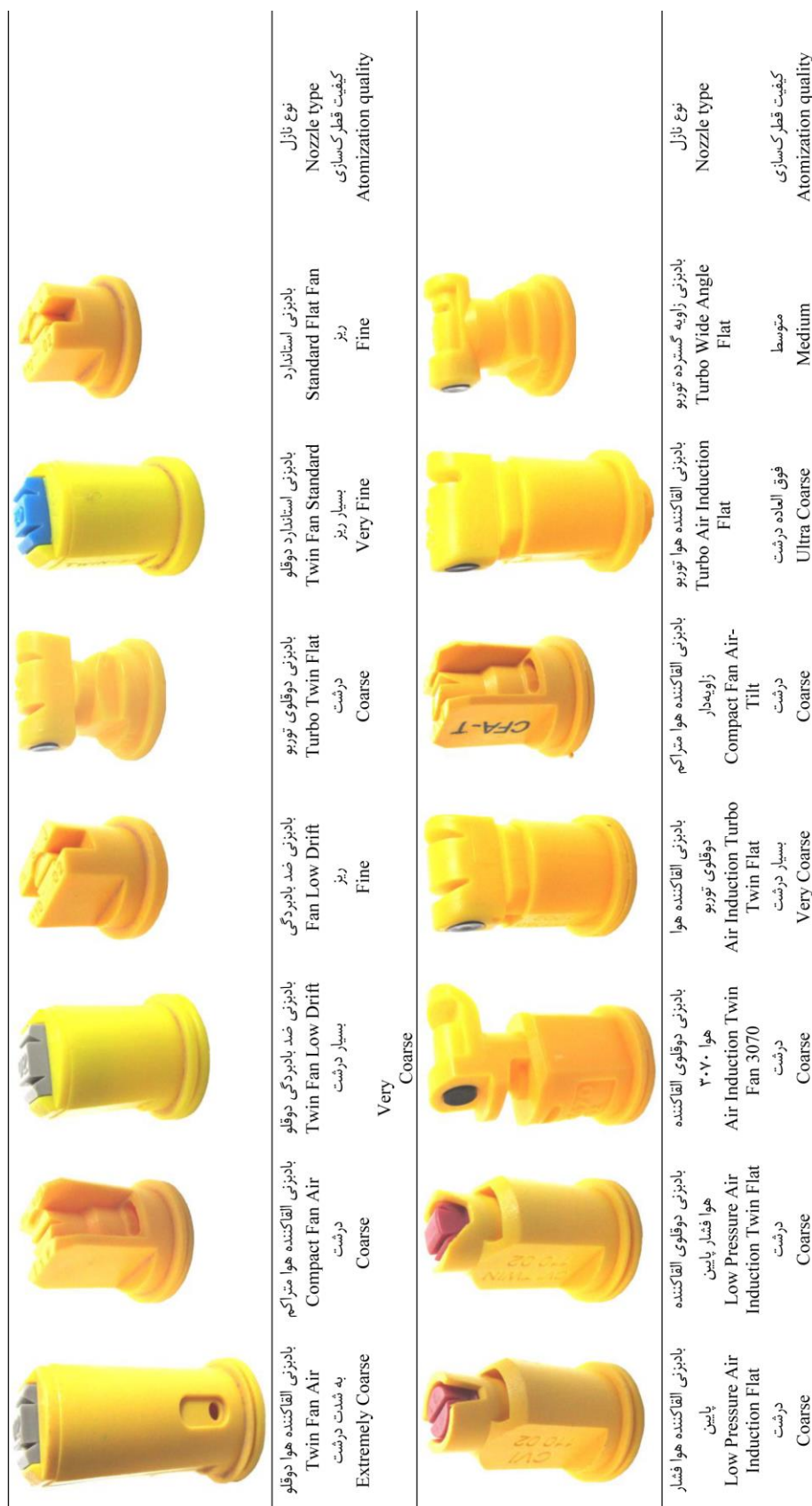
شکل ۱- نازل‌های مورد استفاده در پژوهش و کیفیت قطر کساری آنها در فشار ۳ بار. Figure 1- The nozzles used in research and their atomization quality at 3 bar.