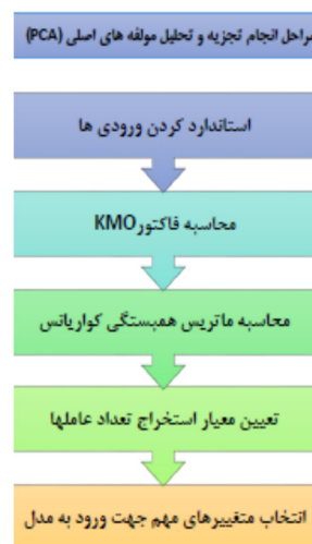
شکل ۱- مراحل تحلیل مولفه‌های اصلی (PCA)

این الگوریتم برای ساخت یک درخت تصمیم‌گیری، داده‌ها را متناوباً به زیر مجموعه‌های مشابه افزایش می‌کند تا آنجا که هر زیر مجموعه دارای تعداد مشخصی نمونه شود. این الگوریتم می‌تواند درختی تولید کند که در برخی از مواقع به صورت غیر دو دویی عمل کند، در واقع از روش جدا کردن چند تایی به جای جدا کردن دو دویی استفاده می‌کند. در این روش از مقدار P-Value آماره کای-دو مربوط به آزمون استقلال جداول توافقی، استفاده می‌شود. از بین متغیرهای موجود، تغییری که دارای P-Value کوچک‌تری باشد در مرحله اول برای تقسیم‌ها روی یک گره در نظر گرفته می‌شود. به بیان دیگر، CHAID ابتدا تفاوت‌های هر نمونه را با سایر نمونه‌ها می‌یابد و درخت مورد نظر را تولید می‌کند. هرس کردن درخت از طریق یافت تفاوت‌های مشابه انجام می‌شود. جهت اعتبارسنجی مدل درختی، داده‌ها به دو بخش داده‌های آموزش و آزمون تقسیم شدند مدل درختی با استفاده از داده‌های آموزش ساخته شد و مدل ساخته شده بر روی داده‌های آزمون مورد تست قرار گرفتند. درصد نمونه‌هایی از داده‌های آزمون که ویژگی هدف آنها توسط مدل، درست تشخیص داده شده بود دقت مدل