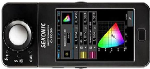
شکل ۱- دستگاه SEKONIC-7000

بینایی است و برای انجام کارهایی که نیاز به راحتی دید دارند آن است که روشنایی در سطح کار به صورت یکدست توزیع شود. در این مطالعه به منظور محاسبه شاخص یکدستی و مقایسه با مقادیر استاندارد، از فاکتور نسبت یکنواختی ( E_{min}/E_{avg} )، برای توزیع شدت روشنایی استفاده شد و برای ارزیابی وضعیت روشنایی محیط کار مورد استفاده قرار گرفت. اگر مقدار به دست آمده برای شاخص یکدستی توزیع شدت روشنایی کمتر از 0/6 باشد، باعث ایجاد مشکلات و اختلالات دید می شود که برای روشنایی فضاهای بسته و اتاق های کار مهم است (۶). معیار ورد به مطالعه نداشتن سابقه جراحی چشم و مشکلات بینایی (آب مروارید آستیگماتیسم و ...) و تمایل به ادامه همکاری تا پایان مطالعه بود. برای ارزیابی خستگی بینایی از پرسشنامه خستگی بینایی که روایی و پایایی آن مورد تأیید است استفاده شد (۲۴). پرسشنامه سنجش خستگی بینایی یک ابزار ۱۵ گویه ای است که با داشتن ۴ مؤلفه میزان خستگی بینایی را در کارکنان مورد ارزیابی قرار می دهد. نمره گذاری این پرسشنامه بر اساس طیف لیکرت و از ۰ تا ۱۰ و از وجود ندارد تا بسیار شدید درجه بندی شده است. مؤلفه های پرسشنامه شامل: استرس چشمی (جمع سؤالات ۱-۴-۱۱-۱۴)، اختلال دید (جمع سؤالات ۷-۸-۱۲-۱۳-۱۵)، اختلال سطح چشم (جمع سؤالات ۶-۹-۱۰) و مشکلات خارج چشمی (جمع سؤالات ۲-۳-۵) هستند. مجموع امتیازات این سؤالات محاسبه و سپس بر ۱۵ تقسیم می شود. نمره ۰ تا ۴ خستگی بینایی کم و نمره ۵ تا ۱۰ خستگی بینایی زیاد است. در جدول ۱ سؤالات مربوط به پرسشنامه خستگی بینایی آمده است. تحلیل داده ها با استفاده از نرم افزار SPSS 21 انجام شد و از روش های آمار توصیفی و آزمون استقلال دو متغیر کیفی توزیع کای دو استفاده شد.