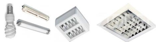
شکل ۱- انواع چراغ‌های فلورسنت استفاده شده در محیط اداری