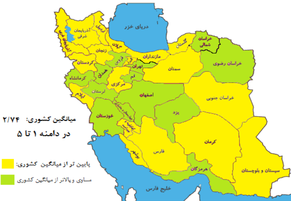
شکل ۱- توزیع سرمایه اجتماعی در استان‌های ایران نسبت به میانگین کشوری

که در نتایج مربوط به آن به مقدار سرمایه اجتماعی در بین کارکنان اشاره‌ای نشده است. مطابق نتایج تحقیق نام‌برده، سرمایه اجتماعی بر سرمایه فکری تأثیر معناداری دارد. پژوهشی که در سال ۲۰۱۸م بین کارگران ۵ کارخانه در شهر بابل گویای این بوده که میانگین امتیاز سرمایه