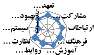
شکل ۳- میانگین امتیاز سازه های بخش فاکتورهای سازمانی ابزار