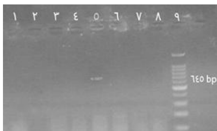
شکل ۴- الگوی PCR با پرایمر VANR, VANR1 (راست)، با پرایمر VANH, VANH1 (چپ)