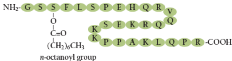
شکل ۱- ساختار گرلین انسانی. گرلین یک پپتید ۲۸- آمینو اسیدی است که در محل Ser 3 توسط n- اکتانویک اسید (n-octanoic acid) اصلاح شده است. این تصحیح برای فعال شدن گرلین ضروری است (۷)

اهمیت کنترل چاقی، اشتها، پیچیدگی های آن و دستیابی به دانش بیشتر، فن‌آوری و روش های تشخیصی مناسب، تلاش پژوهشگران را دوچندان ساخت، به صورتی که بافت چربی، عضله اسکلتی و کبد به عنوان اندام های درون ریز شناخته شده و بر نقش آن ها در متابولیسم مواد غذایی تأکید شده است. با کشف پپتیدهای ترشح شده مؤثر بر اشتها از دستگاه گوارش، نقش این هورمون ها در تعادل انرژی پر رنگ تر گردید و معده نیز مانند بافت چربی، عضله و کبد به عنوان یک اندام درون ریز مؤثر بر تعادل انرژی شناخته شد. در واقع هرچند نقش عوامل مرکزی در تنظیم تعادل انرژی از اهمیت زیادی برخوردار است، اما پژوهش های بسیاری نشان داده که پیام های محیطی به دست آمده از بافت های مختلف بدن ی بر کنترل هومئوستاز انرژی از جمله دریافت و هزینه آن تأثیر به سزایی دارند (۲).