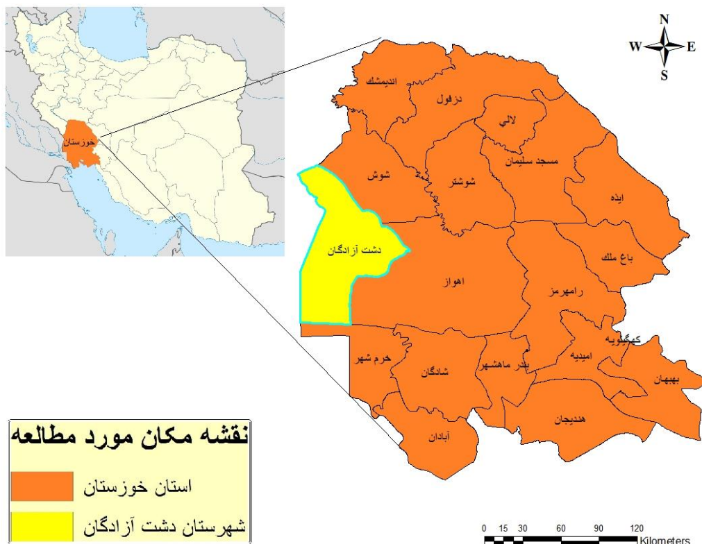
شکل ۱: شهرستان دشت آزادگان، استان خوزستان

در مجموع افراد مورد مطالعه ۷۸۶ نفر (۵۹٪/۵۴) دارای یک زخم، ۲۲۸ نفر (۱۷٪/۲۷) دارای دو زخم و ۳۰۶ نفر (۲۳٪/۱۸) دارای سه زخم یا بیشتر بودند و تعداد ضایعات فعال بر روی بدن بیماران بین ۲۱ تا ۲۱۱ عدد بود.