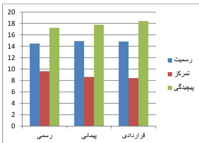
شکل ۱: نمودار ابعاد ساختار سازمانی به تفکیک نوع استخدام در افراد مورد مطالعه

در زیر نمودارهای میانگین ابعاد ساختار سازمانی و تحلیل رفتگی شغلی به تفکیک نوع استخدام در افراد مورد مطالعه ارائه شده است. همان طور که دیده شد میانگین بعد پیچیدگی در بین هر سه گروه کارکنان قراردادی، پیمانی و رسمی بیش از میانگین ابعاد تمرکز و رسمیت در بین کارکنان قراردادی بیش از پیچیدگی در بین کارکنان قراردادی بیش از پیچیدگی کارکنان رسمی و پیمانی بود. متغیر تمرکز کمترین میانگین را در بین ابعاد ساختار سازمانی در بین کارکنان به تفکیک نوع استخدام