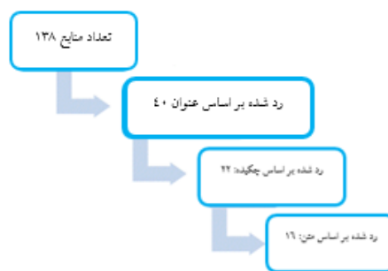
نگاره ۱. روند سرنده و فیلتر مقالات

این پژوهش در دو گام انجام شده است. در گام نخست به منظور بررسی پژوهش‌های انجام شده در مورد موضوع و قلمرو خاص از روش نظام‌مند استفاده شده است. بدین منظور کلید واژه شایستگی مدیران (competencies managers) در بازه زمانی ۲۰۰۶-۲۰۲۰ در پایگاه‌های اطلاعاتی؛ Science Direct، Springer، Wiley Online Library، ERIC، Sage Journals، Emerald جستجو شد و مقالات بدست آمده در چند مرحله مورد ارزیابی قرار گرفت و نتایج به منظور دستیابی به هدف پژوهش مورد بررسی قرار گرفت. در تمامی مراحل بررسی مقالات، ملاک‌ها و معیارهای مطالعه نظام‌مند رعایت شد. روی هم رفته، ۱۳۸ پژوهش استخراج شد که به منظور ارزیابی کیفیت مقالات و استخراج داده‌ها برای اطمینان چندین بار مقالات واکاوی و بازخوانی شدند که در نهایت ۶۰ پژوهش به تحلیل نهایی راه یافت. نگاره (۱) روند فیلتر مقالات در سه مرحله رد شده بر اساس عنوان، چکیده و متن مقاله را نشان می‌دهد؛